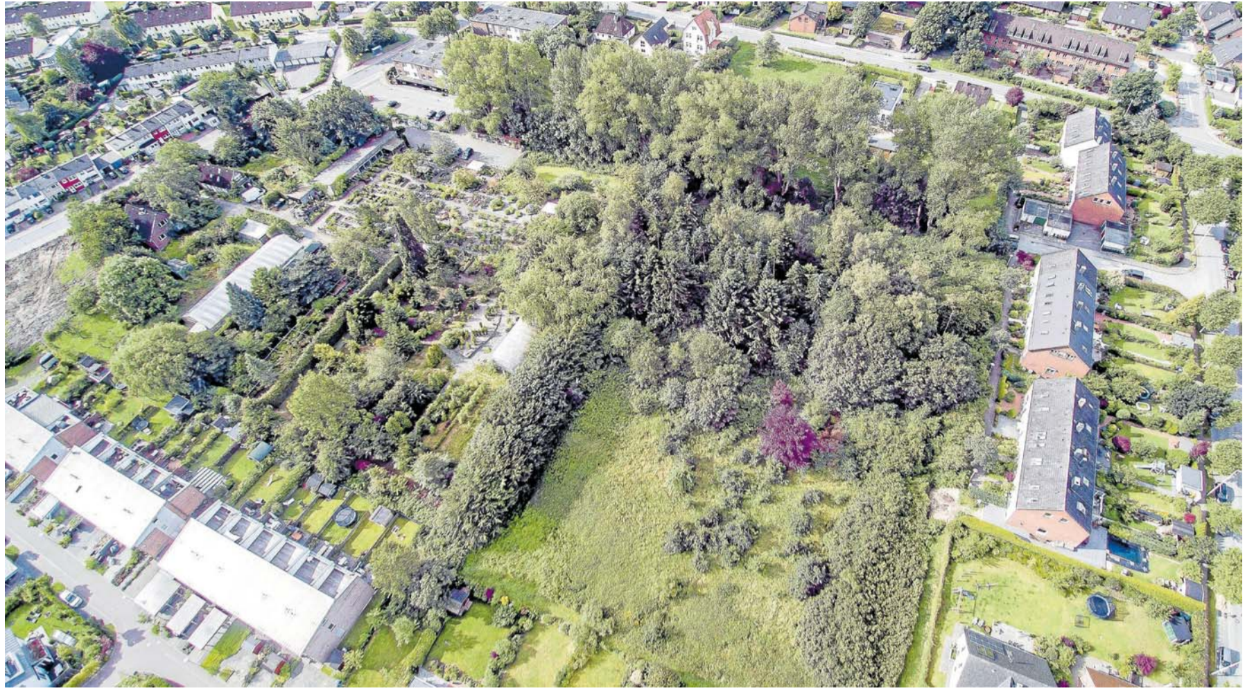
Ein Investor plant auf dem Areal Klemms Gartenmarkt in Kronshagen einen Wohnpark für ältere Menschen mit ambulanter Pflege und weiteren Dienstleistungen. Der Gartenmarkt wird für das Vorhaben weichen.